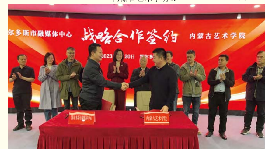
内蒙古艺术学院与鄂尔多斯融媒体中心战略合作签约仪式