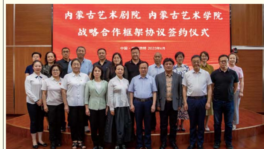
内蒙古艺术学院与内蒙古艺术剧院战略合作框架协议签约仪式

内蒙古艺术学院举办主题教育读书班3期，组织党委理论学习中心组专题学习10次，邀请专家学者做专题讲座5次，深入学习习近平总书记重要讲话重要指示精神以及党中央、自治区主题教育的重要指示精神、习近平总书记关于教育的重要论述、习近平总书记关于文艺工作的重要论述及“千万工程”经验案例等内容，跟进学习习近平总书记最新重要讲话和文章，深刻领悟贯彻新发展理念、构建新发展格局、推动高质量发展的核心要义，突出对以两件大事为抓手推进内蒙古现代化、推进学校高质量发展的学思践悟。