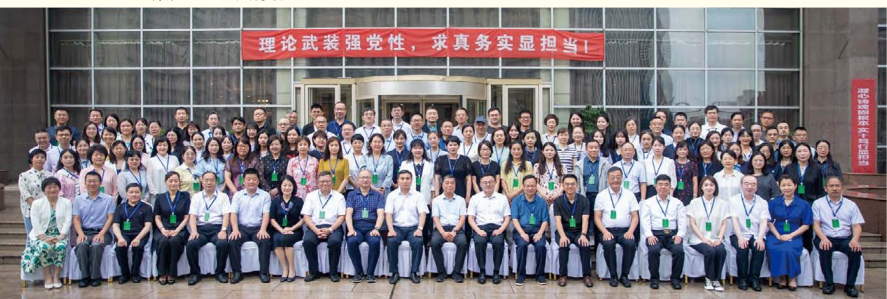
闭幕会后合影留念