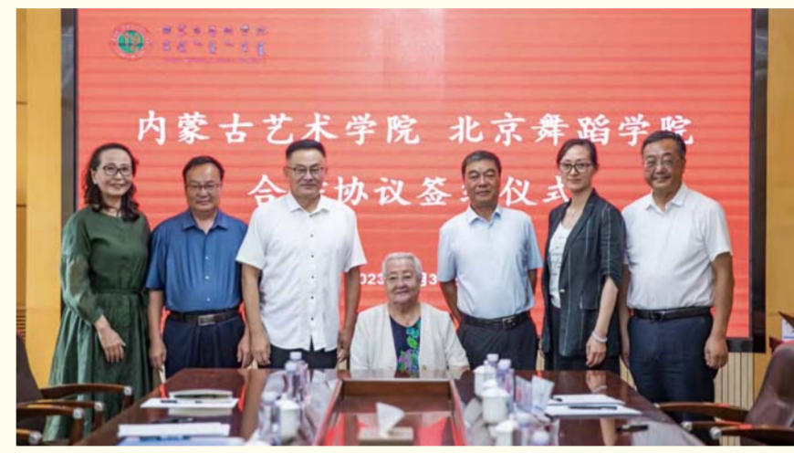
内蒙古艺术学院与北京舞蹈学院签订合作框架协议

内蒙古艺术学院把主题教育和完成好“五大任务”、全方位建设模范自治区两件大事紧密结合起来，紧紧围绕学校改革发展本科教学工作合格评