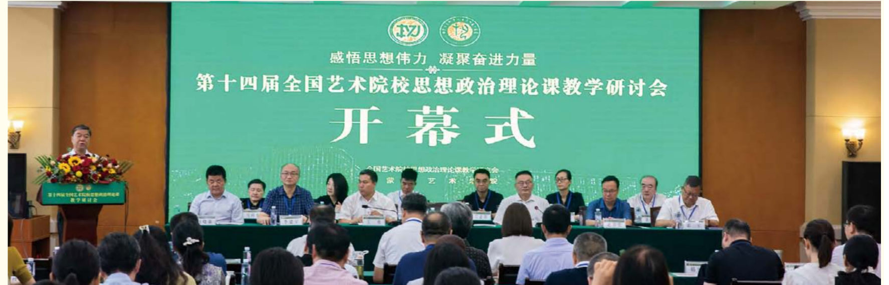
第十四届全国艺术院校思想政治理论课教学研讨会开幕式现场