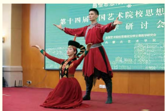
内蒙古艺术学院乌兰牧骑艺术实践课堂展示