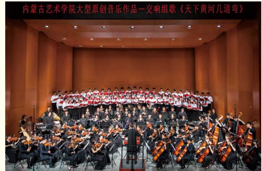
交响组歌《天下黄河几道弯》演出场景

年文艺演出。成立了“内蒙古艺术学院艺谷文化”艺术有限责任公司，主动服务和融入新发展格局，助力区域文化艺术繁荣发展。 新时代催人奋进，新征程笃行不怠。内蒙古艺术学院党委将进一步深化主题教育成果，持续锚定高质量发展目标，把主题教育中凝聚的共识、形成的经验、明确的思路转化为落实立德树人根本任务、培养德智体美劳全面发展的社会主义建设者和接班人的实际成效，转化为促进学校各项事业蓬勃发展的强大动力，为全面建设社会主义现代化国家、推进中华民族伟大复兴贡献智慧和力量。