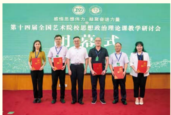
巴图会长颁发研究会理事聘书